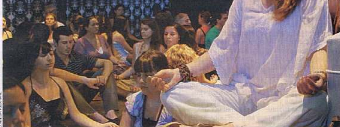
CORTESÍA YOGA RAVE

48 TENDENCIAS Yoga Rave, la paz electrónica.